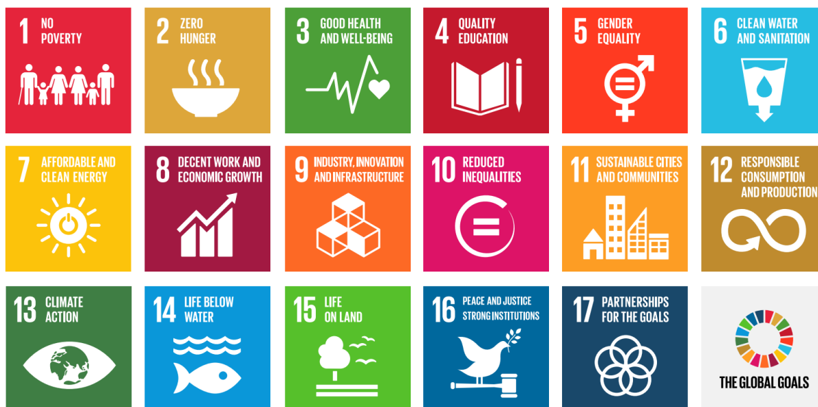
Figuur 1: Pictogrammen per Global Goal

De Sustainable Development Goals worden op verschillende manieren geuit. Via pictogrammen, zoals in onderstaand figuur 1 is weergegeven, maar ook via het officiële 'SDG-merkrichlijn' van de Verenigde Naties, zie figuren 2 en 3.