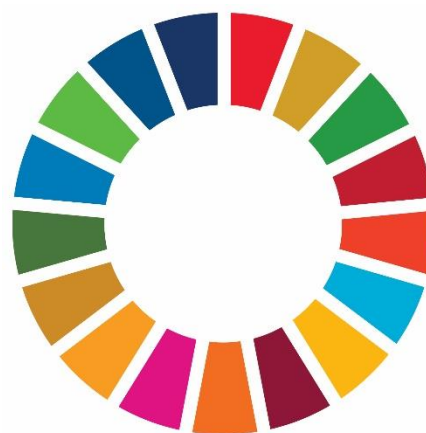
Figuur 3: SDG-circle

Wat opvalt is de ronde SDG-cirkel die veel gebruikt wordt bij promotiedoeleinden. De gekleurde vakjes symboliseren de 17 doelstellingen. Kenmerkend aan een cirkel is de gelijkwaardigheid en het gesloten karakter. Vrij vertaald betekent de SDG-cirkel dat alle doelstellingen hand-in-hand met elkaar gaan en elkaar, al dan niet via andere doelstellingen, verbinden en versterken. Samen vormen ze een krachtige cirkel om alle wereldproblemen het hoofd te bieden.