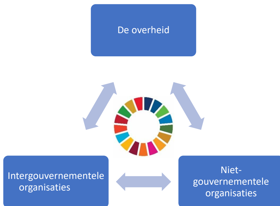
Figuur 4: samenwerking tussen overheid, NGO's en intergouvernementele organisaties inzake Global Goals

Schematisch ziet de samenwerking er als volgt uit. Centraal in de samenwerking staat het behalen van de 17 SDG's.