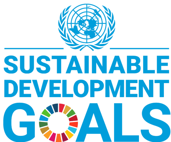
Figuur 2: Officiële SDG-merkrichlijn van de VN